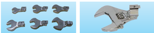
付属スパナヘッドイメージ 付属モンキーヘッドイメージ